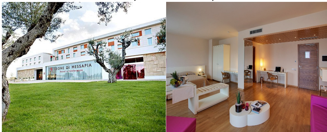
RESIDÊNCIA DA ESCOLA, SEDE DO CEDEUAM, CIDADE DE LECCE